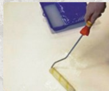
3. Обратная сторона полотна покрывается клеем при помощи малярного валика и выдерживается в таком состоянии в течении 5 - 7 минут.