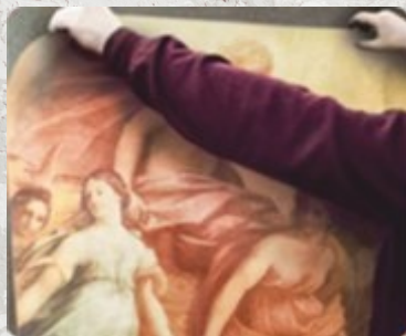
5. Пропитавшиеся клеем обои накладываются на стену.