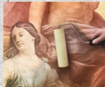
6. Складки и пузыри раскатываются валиком для обоев.