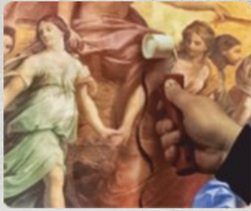
7. Стык разглаживается узким валиком.