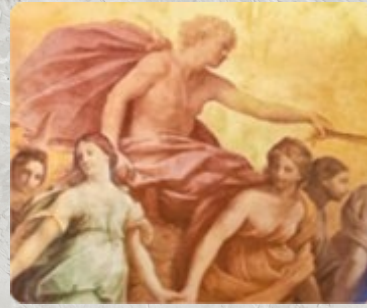
8. Стык между полотнами будет незаметен, если монтаж выполнен аккуратно.