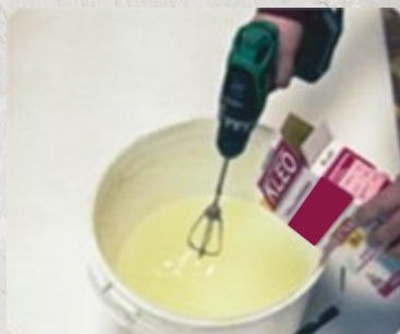
2. Развести клей для флизелиновых обоев в соответствии с инструкцией.